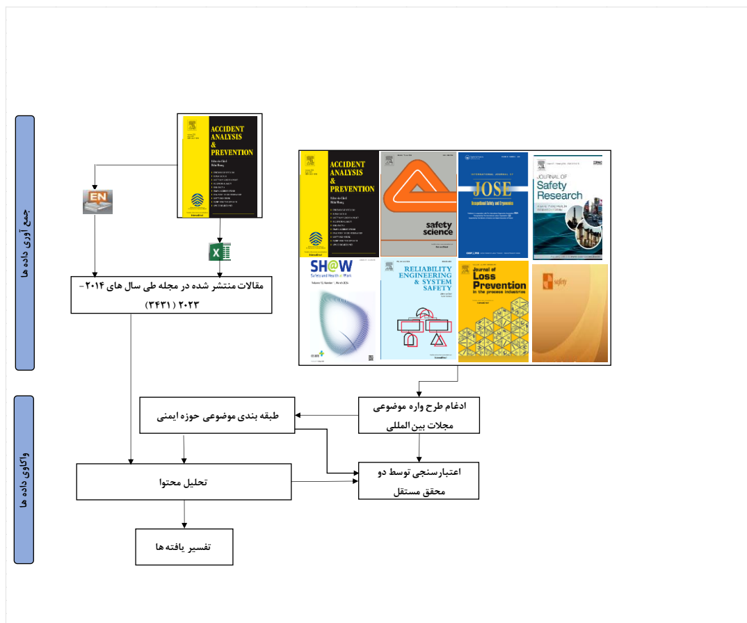
شکل ۱. طراحی مطالعه

حوزه ایمنی ارائه گردید و آنها دسته‌بندی موضوعی مختلف مجلات بین‌المللی را به‌عنوان ابزار گردآوری داده، نهایی کردند. این دسته‌بندی شامل ۲۷ گروه بود که به منظور سهولت در دسته‌بندی، کدهای آنها از S1 تا S27 در نرم‌افزار Excel 2021 انجام شد (جدول ۱).